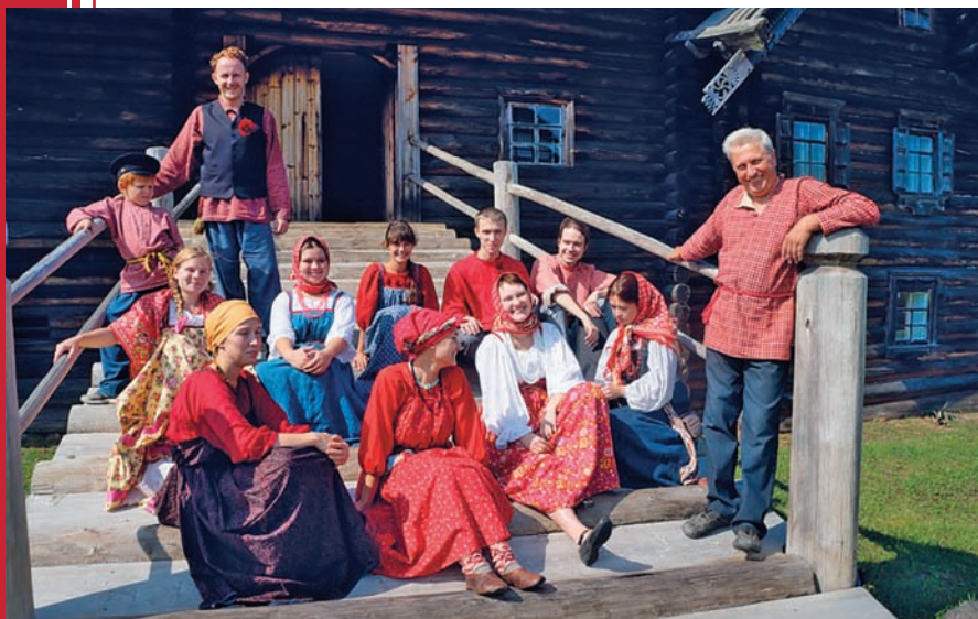
Фольклорно-этнографический театр МГУ им. М.В. Ломоносова «Братыня»