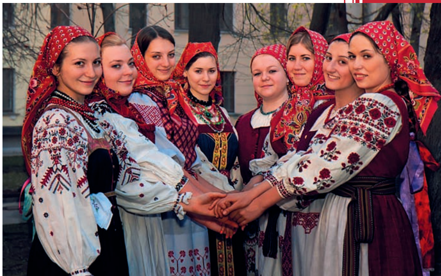
Ансамбль Российской академии музыки им. Гнесиных