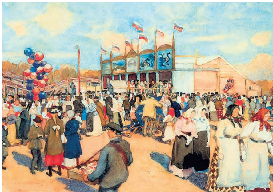
К. Ф. Юон. Гулянье на Девичьем поле. 1909. Эскиз к картине. Из собрания Государственной Третьяковской галереи.

Идея программы фестиваля «Девичье поле» — показать глубокие связи и взаимное влияние литературы и фольклора, представить, как русская литература обогатила фольклор, продемонстрировать, как органично входят народные песни в фольклорный репертуар и как русские писатели и поэты используют в своем творчестве фольклорные мотивы.