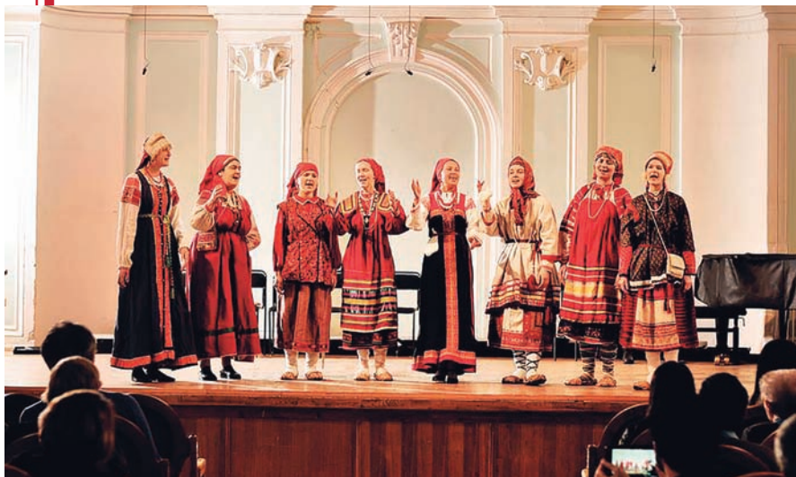
Ансамбль Московской государственной консерватории им. П. И. Чайковского