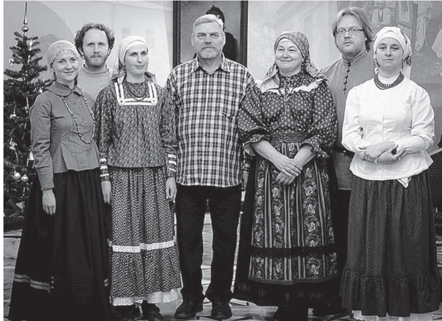
Клуб традиционной казачьей песни «Петров Вал»

В программе прозвучат песни терских и кубанских казаков, имеющие литературное происхождение. Их до недавнего времени можно было услышать и записать в казачьих станицах. Песни на стихи Пушкина, Лермонтова, Плещеева органично вошли в фольклорный репертуар казаков. Эти песни и романсы выдержали испытание временем и встали в один ряд с шедеврами русского песенного фольклора.