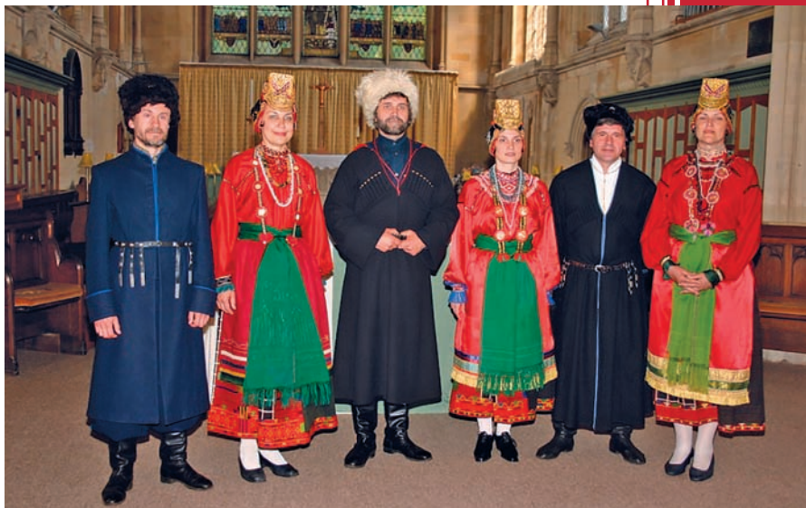
Ансамбль «Русская музыка»