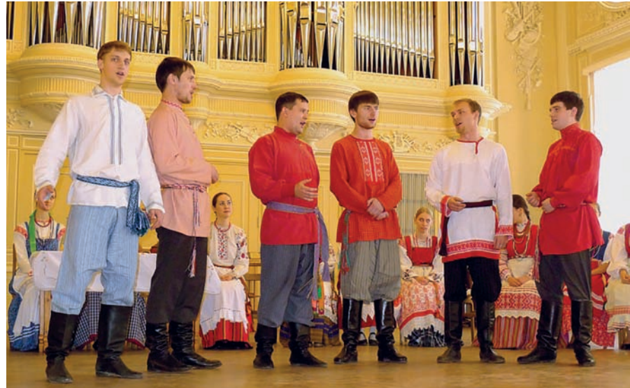
Ансамбль Санкт-Петербургской государственной консерватории им. Н. А. Римского-Корсакова