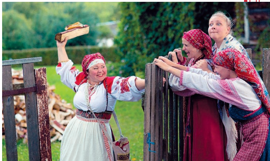
Фольклорный ансамбль «Плескава»