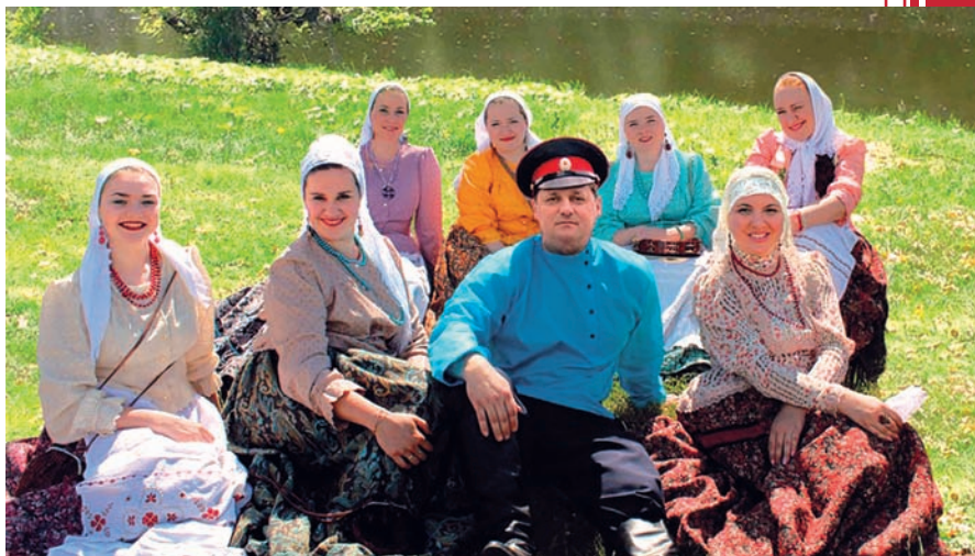
Ансамбль старинной казачьей песни «Покров»