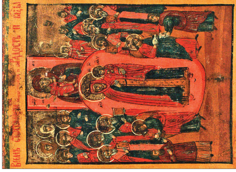
Всех скорбящих радость. XIX—XX в. Занеже (д. Шабалино, Медвежьегорский р-н). 30 × 24 × 2. Левкас, темпера. Доска липовая, цельная. Шпонки торцевые. Ковчега нет. Опушь двойная — красная и зеленая. Поля равновеликие, светло-охряные, внутренняя обводка черная. Сохранность: выпадение левкаса на нижнем поле. Реставрация 1984 г.

Читайте статью В.П. Ершова «Крестьянские иконы Карелии» на с. 2—5.