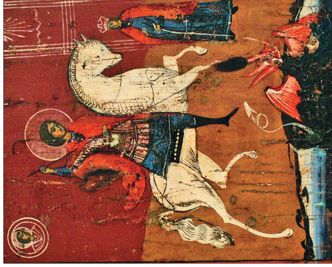
Чудо св. Георгия о змие. XIX в. Петрозаводск. Дар старообрядца В.Я. Лубакова, 2005 г. (Москва). 30,5 × 25,5 × 1. Левкас, темпера. Доска клееная, из двух частей. Шпонки встречные врезные широкие. Без ковчега. Поля почти равновеликие. Опушь двойная синяя, с небольшим отступом от нее — белая, внутренняя рамка черная. Сохранность: продольное шелушение по красному слою иконы; отсутствуют обе шпонки. Реставрация 2005 г.