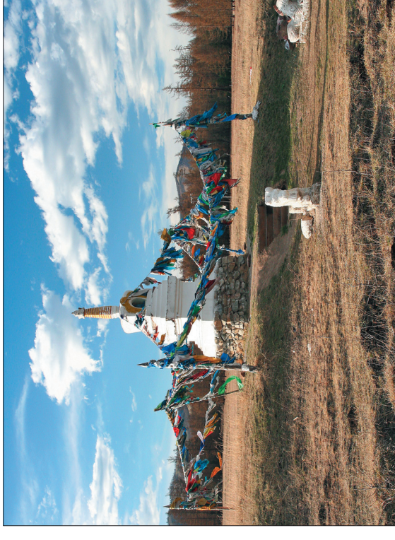
Ступа на перевале Хамар-Доба

Журналы «Народное творчество», «Живая старина», «Традиционная культура» и книги, изданные Центром русского фольклора, можно приобрести за наличный или безналичный расчет по адресу: 119034, Москва, Турчанинов пер., д. 6 (желательно в понедельник и четверг с 11.00 до 18.00); тел.: (499) 245-2205, 245-2079