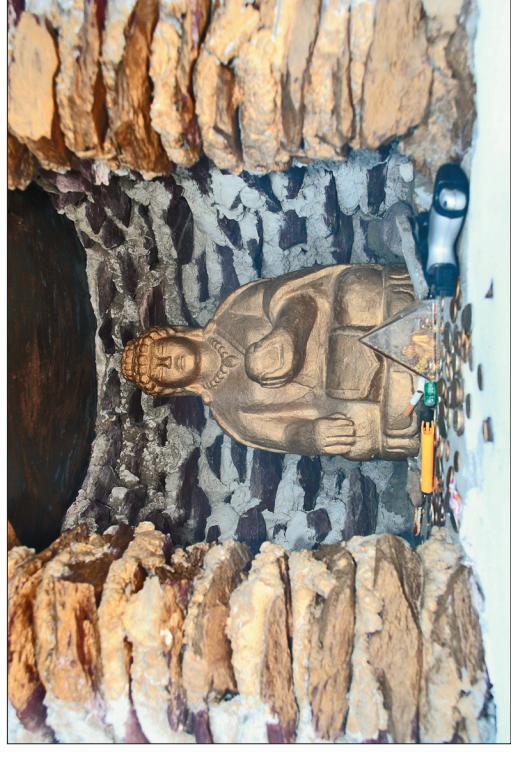
Ниша ступы в районе пос. Кизыл-Мажалык