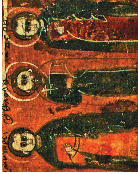
Дмитрий, Флор и Лавр (фрагмент иконы-трехрядницы «Избранные святые»). Конец XVIII — первая половина XIX в. Сеозерье (д. Пелкула, Медвежьегорский р-н). 26,5 × 23,5 × 3. Левкас, темпера. Доска липовая, цельная, шпонка одна, врезная, несквозная, ковчег двойной. Сохранность: утрачены лики некоторых святых. Реставрация 1970 г.