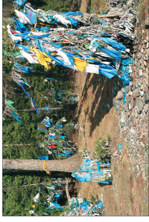
Святое место на перевале Хамар-Доба (между пос. Шуурмак и Самасгалтай)