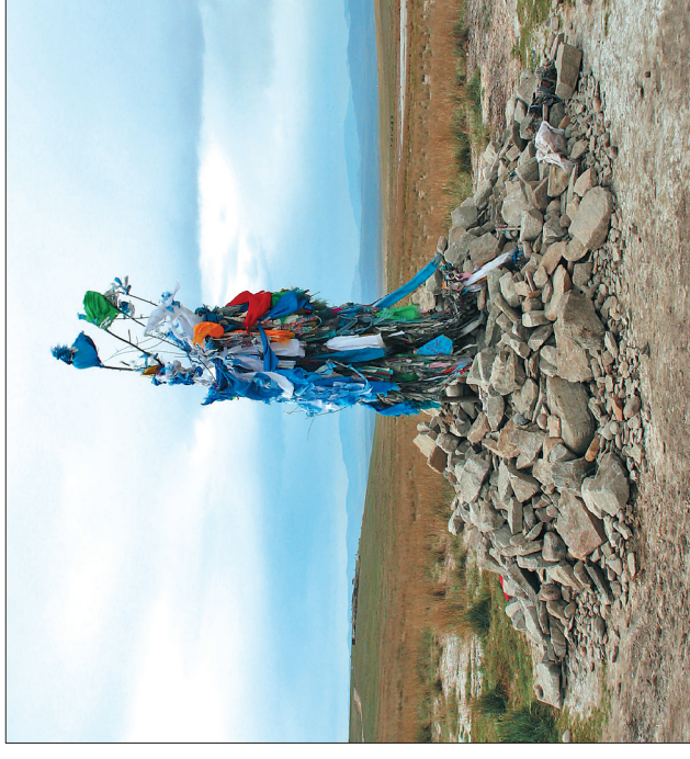
Святое место — оваа в окрестностях Кизыла

Реставрация В.П. Ершова