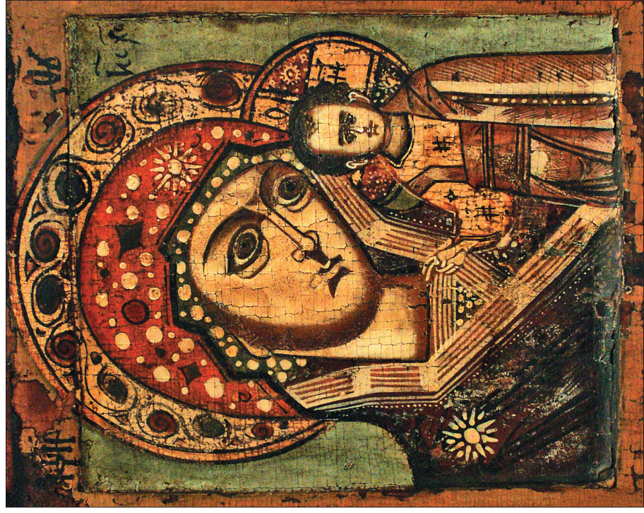
Богородица Казанская. XVIII в. Занеже (д. Накитино, Медвежьегорский р-н). Дар Л. Стафеевой, 1974 г. 28 × 23 × 2,7. Левкас, темпера. Доска липовая, цельная. Шпонка одна несквозная. Двойной ковчег. Сохранность удовлетворительная, отдельные выкладки левкаса на полях. Предположительно икона старообрядческая. Реставрация 1980 г.

«Северные письма», созданные местными иконописцами, давно получили признание исследователей. Меньше в этом отношении повело иконам-примитивам — «краснушкам», «чернушкам», «пялницам», которые писали деревенские «богомазы». Появление таких «препростых» художников стало возможным по мере освоения иконописания в местных центрах.