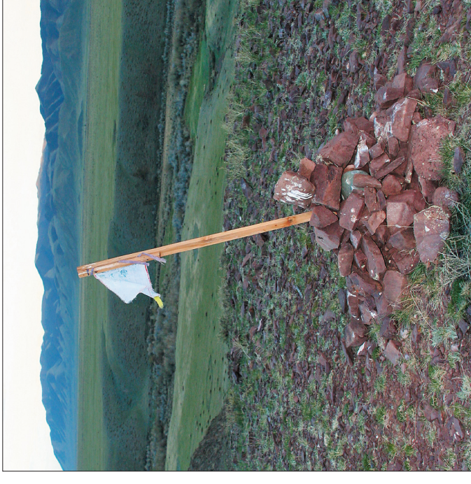
Святое место — оваа в окрестностях пос. Самасгалтай