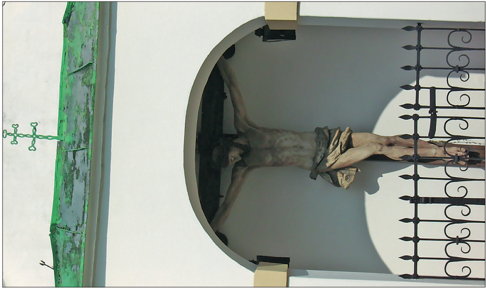
Часовня св. Креста

В 2007 г. состоялась этнолингвистическая Экспедиция Института славяноведения РАН к градишанским хорватам Австрии. Славяне-хорваты, живущие здесь с XVI в., сохранили свои национальные обычаи, обряды и поверья несмотря на влияние окружающей инокультурной ментальности и религиозно-католической веры.