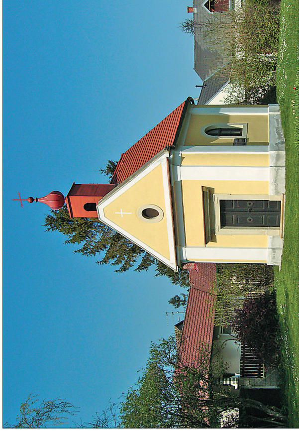
Часовня св. Магдалены