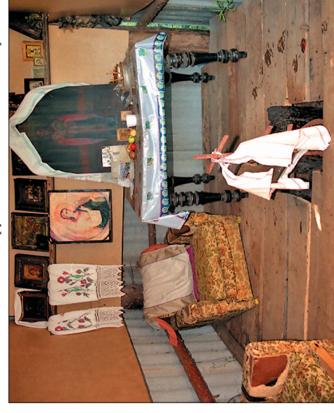
Интерьер часовни св. Василия Великого в Большом Одошнуре. В центре «Божий столбик», на столе икона св. Василия Великого