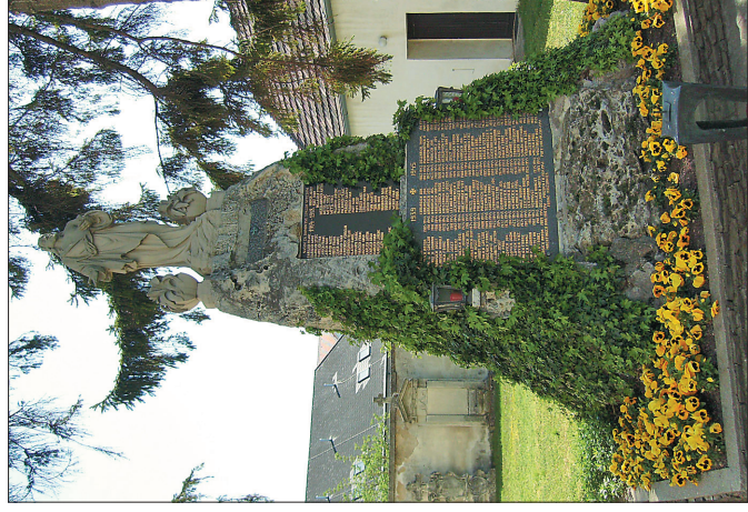
Святое место Грегчин Бог