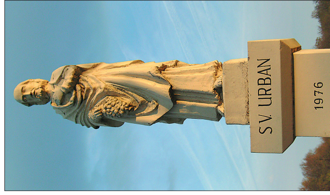
Статуя св. Урбана