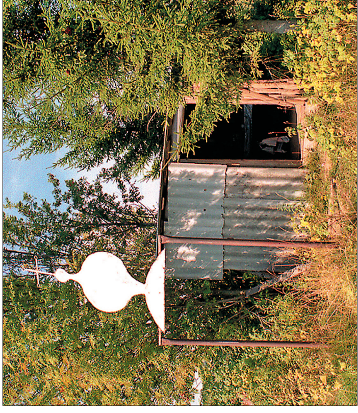
Часовня св. Василия Великого в Большом Одошнуре, окруженная почитаемыми деревьями