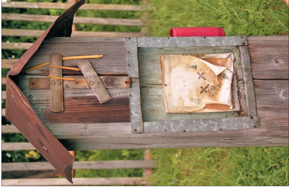
«Божий столбик» Николая-Угодника (Юмон-Мелька Николай-Юмо) в с. Большие Ашкаты

Кереметище Куман-матэ в 1,5 км к северу от Большого Одошнура, на территории исчезающей деревни Верхонижемское. Сюда, по местным легендам, с неба через осяенные ворота спускался Бог: «Счас всё вьдэ в природе изменилось. Раньше всё это было наверху, всё было! Где-то вот ворота открывались на небо — вон там Верхонижемский лебе. Ворота — кра-асным цветом, как стрела, обведенная — ворота вот открывалась! В эти ворота как будто Бог входил и выходил. <...> Я вот слышала у бабушки: на Верхонижемском — там это ворота. Ачас мы лице не вьдим, всё вьдэ это нарушилось! На облаке вот ворота красные, говорят, вот так прямо! А вокруг — горит, говорит, прямо! Если через ворота, говорят, выйдешь, так и всегда здоровым будешь! В небо войдешь, говорят, через ворота... А мы говорим: "Как?" Маленькие мы ещё были, думали: "Небо достанем да войдём!" А счас подумаешь — да как вот это? Счас вот такого случая нет» (Л.Л. Стёпышева. 1956 г.р., с. Большой Одошнур Тоншаевского р-на; зап. в 2006 г.)