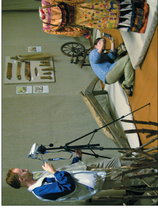
Фото- и видеосъемка в фондах краеведческого музея пос. Лальск Лузского р-на Кировской обл. 2005 г.