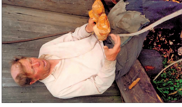
Мастер плетения из бересты. С. Верхораменье Мурашинского р-на Кировской обл. 2003 г.