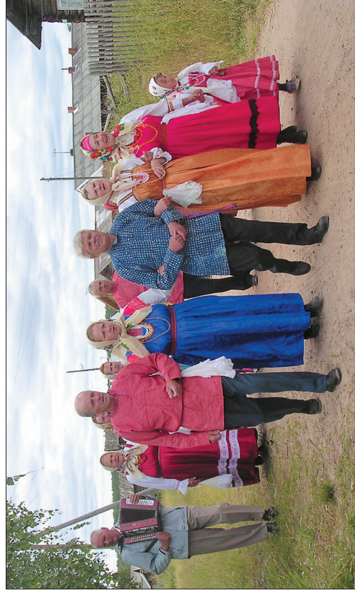
Народные гуляния в с. Веркола Пинежского р-на Архангельской обл. 2007 г.